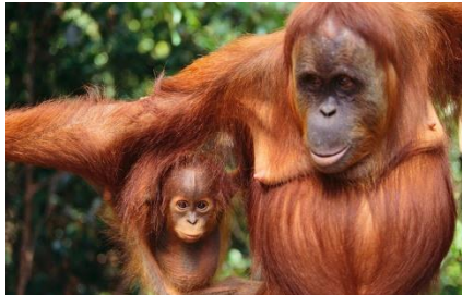
Sumatra-Orang-Utan ( Pongo abelii )

https://www.wwf.de/bild-des-tages/mehr-orang-utans/