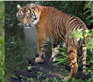
Sumatra-Tiger ( Panthera tigris sumatrae )

https://www.wwf.de/bild-des-tages/zwergelopard/