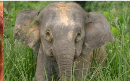
Borneo-Zwergelopard ( Elephas maximus borneensis )

https://www.wwf.de/themen-projekte/artenlexikon/borneo-orang-utan/