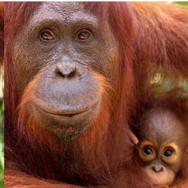
Borneo-Orang-Utan ( Pongo pygmaeus )

https://www.wwf.de/bild-des-tages/mehr-orang-utans/